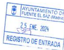
Fdo.: Silvia Asperilla Sánchez

MOTIVO FIRMA: Sra. de Organo HASH DEL CERTIFICADO: 57844B8ABE522A170B44E8B80570BAC3F FECHA DE FIRMA: 25/01/2024 PUESTO DE TRABAJO: Sra. de Organo Firmado en el Ayuntamiento de Fuente El Saz - https://sede.ayuntamientofuentelsaz.com/ - Código de Verificación: 15208D028F865CA40080904E939